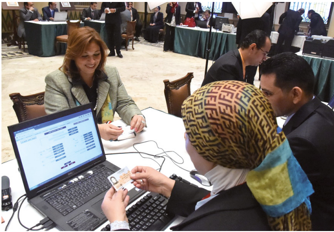
En Egipto, tras las elecciones de 2015, casi el 15% de los parlamentarios son mujeres: un aumento considerable en comparación con resultados anteriores. © Khaled Mashaal, 2015

lo obtuvo una mujer. Aunque ninguno de estos partidos había adoptado cuotas, ambos demostraron una firme cultura interna de inclusividad y sensibilidad al género.