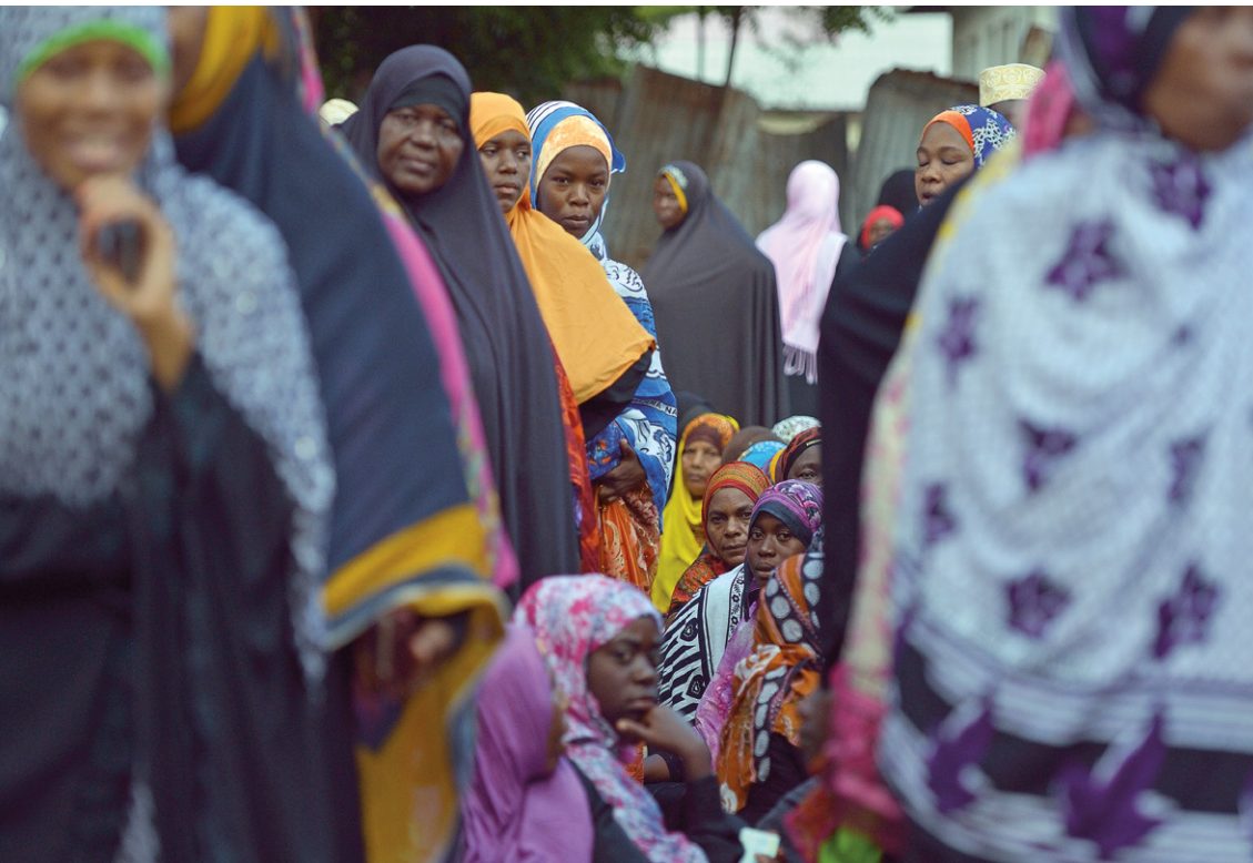
En Tanzania, tras los resultados de las elecciones celebradas en octubre de 2015, las mujeres representan en la actualidad el 36,6% de los parlamentarios en la Asamblea Nacional.

dos de los cinco miembros procedentes de Zanzíbar y cinco de los 10 miembros designados por el Presidente debían ser mujeres. Pero las mujeres también alcanzaron escaños abiertos a competición. Un total de 136 mujeres (36,6%) fueron elegidas para formar parte de la Asamblea Nacional (+7,1 puntos porcentuales). Como muestra de una perdurable resistencia cultural a la participación de las mujeres en la política, las elecciones en el archipiélago de Zanzíbar, según se ha informado, dieron como resultado el divorcio de un número de mujeres por votar en contra de los deseos de sus maridos.