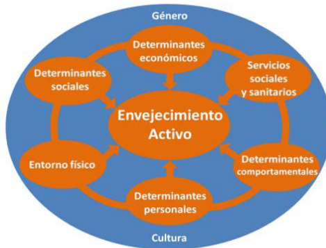
Ilustración 1: Determinantes sociales de la salud del envejecimiento activo y saludable

En este contexto, la posibilidad que una persona adulta mayor viva o no una vejez activa, saludable en que sea posible desarrollar y mantener las capacidades funcionales y en pleno ejercicio de sus derechos depende de una variedad de factores y circunstancias en que las personas nacen, crecen, viven, trabajan y envejecen, los cuales son denominados "determinantes sociales de la salud" (DSS). La OMS (2002; 2020) explica cómo nuestros comportamientos, conductas, estilos de vida, las características de los ambientes físicos, el contexto social, cultural y económico, así como el acceso a servicios de protección a los que hemos accedido y en los que hemos vivido a lo largo de nuestra vida afectan negativamente o positivamente nuestra salud, participación y seguridad en la vejez. Asimismo, se resalta que las desigualdades sociales por razones de género, etnicidad o nivel socioeconómico son importantes marcadores de diferencia, ya que ciertos grupos excluidos social e históricamente en nuestras sociedades acumulan un conjunto de desventajas a través del curso de sus vidas que finalmente tiene repercusiones negativas en la capacidad de vivir una vejez activa y saludable.