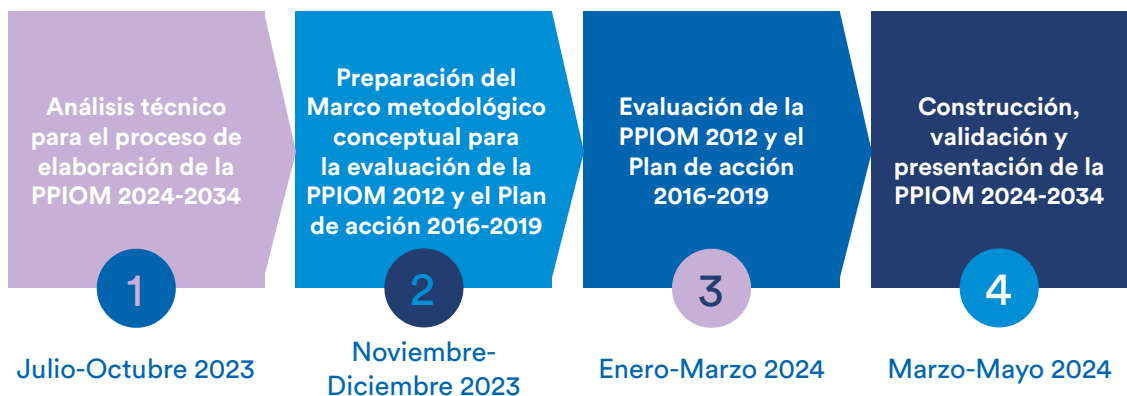
GRÁFICO 2. PROCESO DE CONSTRUCCIÓN DE LA PPIOM 2024-2034

Este ejercicio de análisis crítico- reflexivo de la situación de las mujeres, como la revisión de avances y logros, permitió actualizar los objetivos país y las medidas respectivas para abordar las brechas, aún persistentes para las mujeres y su igualdad de oportunidades. Con el propósito de validar las principales demandas ciudadanas concentradas desde el movimiento de las mujeres, gremios, colegios, sindicatos, empresas privadas, la metodología utilizada contó con un enfoque participativo transversal. De igual manera, en cada etapa se contó con el acompañamiento técnico del Grupo Interagencial de Género de Naciones Unidas, liderado por ONU MUJERES y PNUD, cuyas agencias integrantes participaron en las sesiones de trabajo y validación de resultados.