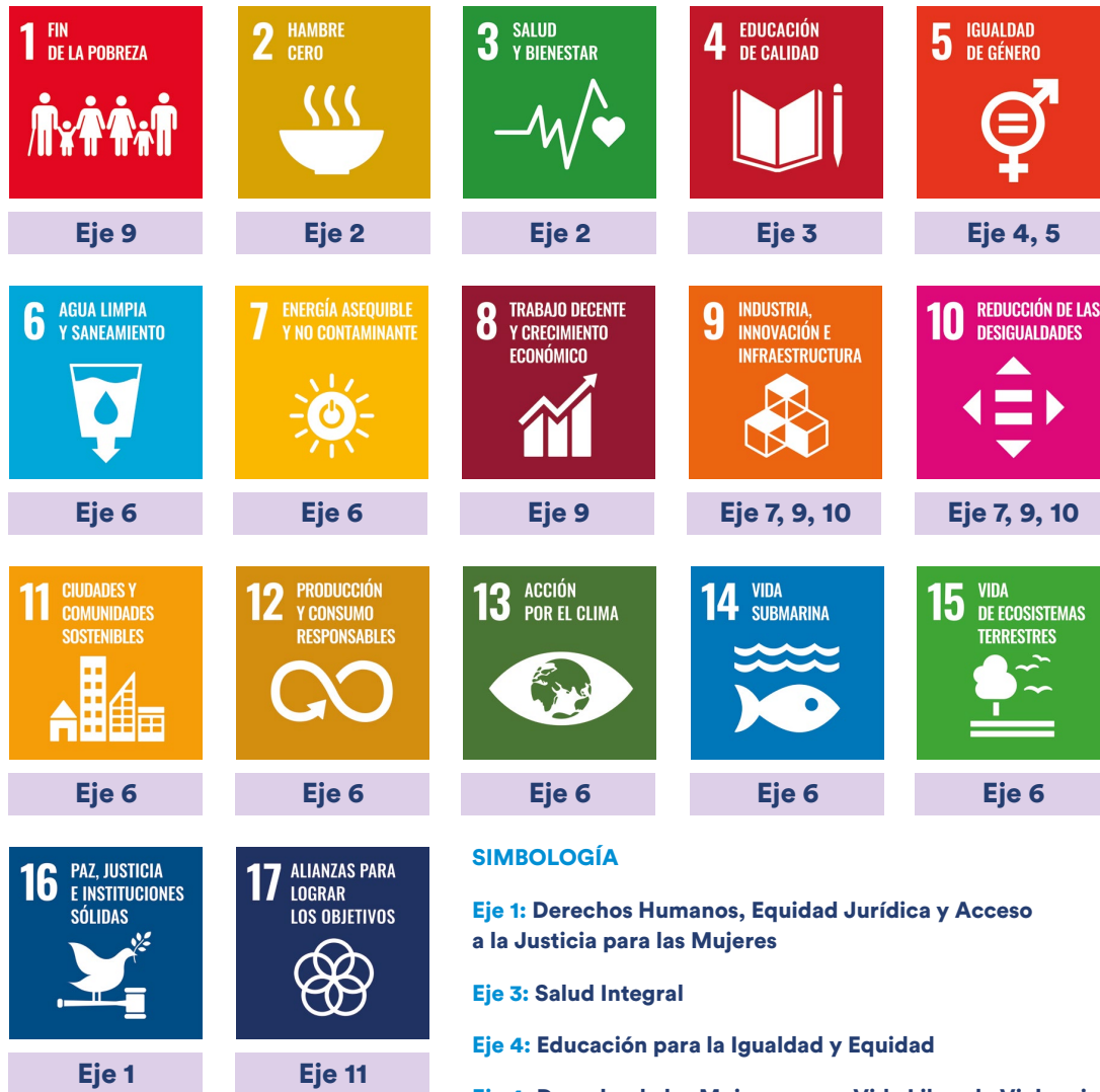
GRÁFICO 1. ARTICULACIÓN DE LA PPIOM 2024-2034 A LOS OBJETIVOS DE DESARROLLO SOSTENIBLE